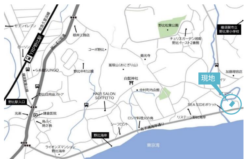
CARNAVI カーナビは「横須賀市野比3-23-7」とセット